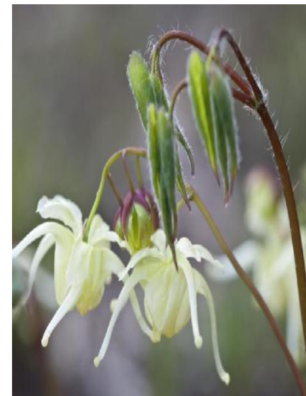
Elfenblume Staude des Jahres 2014